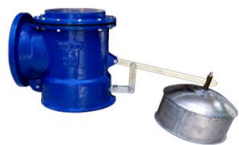
ROBINETS A FLOTTEUR