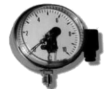
MANOMETRES A GLYCERINE