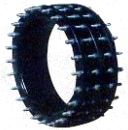
JOINTS DE DEMONTAGE