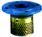
CREPINES A BRIDE