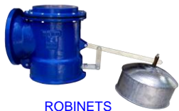
ROBINETS A FLOTTEUR