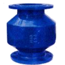
STABILISATEURS S1,5xD & S3XD