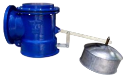
ROBINETS A FLOTTEUR