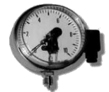
MANOMETRES A GLYCERINE